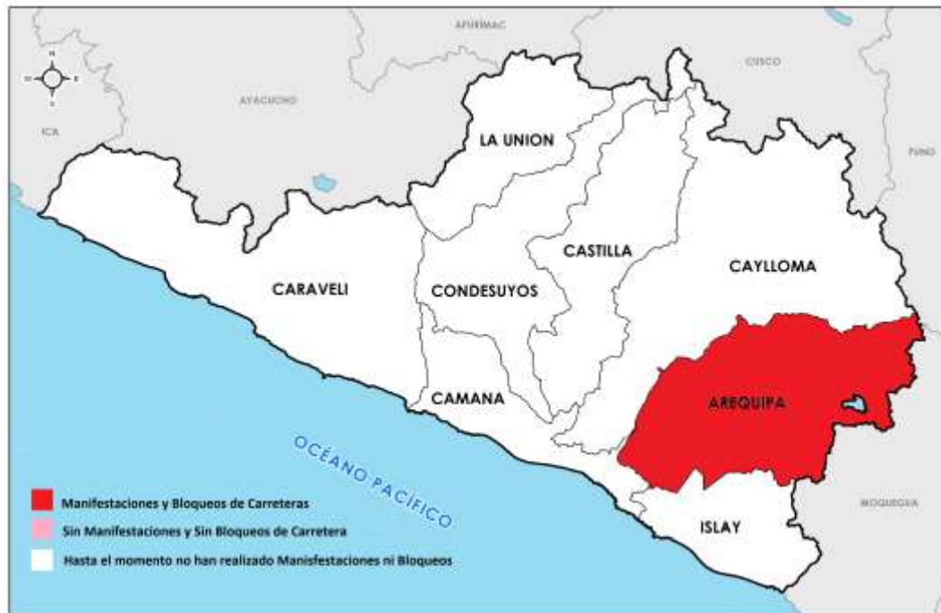
Gráfico Elaborado con Información al DIA: 29 de Enero 2023